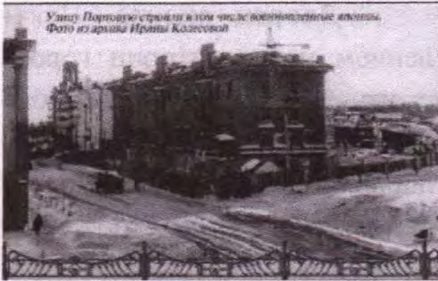
Улицы Парковой строили в том числе военнопленные японцы.